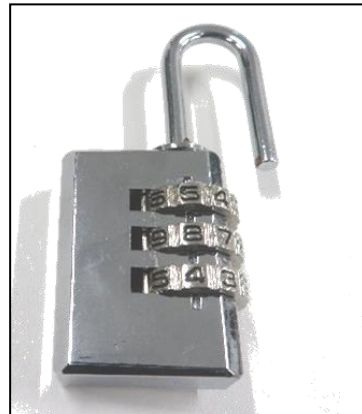
参考 (ダイヤルタイプ)